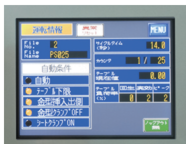
操作モニター画面